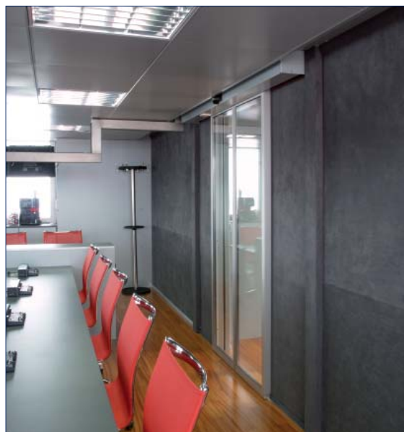
Scuderia Toro Rosso