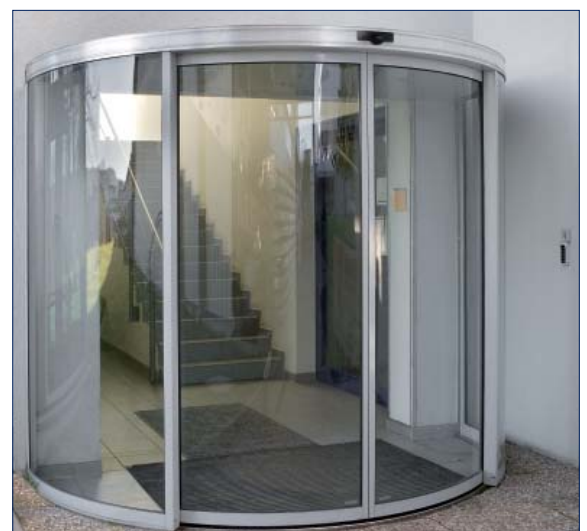
GEZE Technologie- und Entwicklungszentrum

Visoki maska: 150 mm (sa pokrivenim gornjem podnožjem vrata)