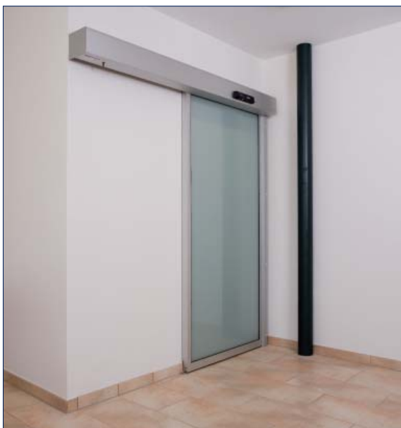
Hubertus Hotel Schluchsee